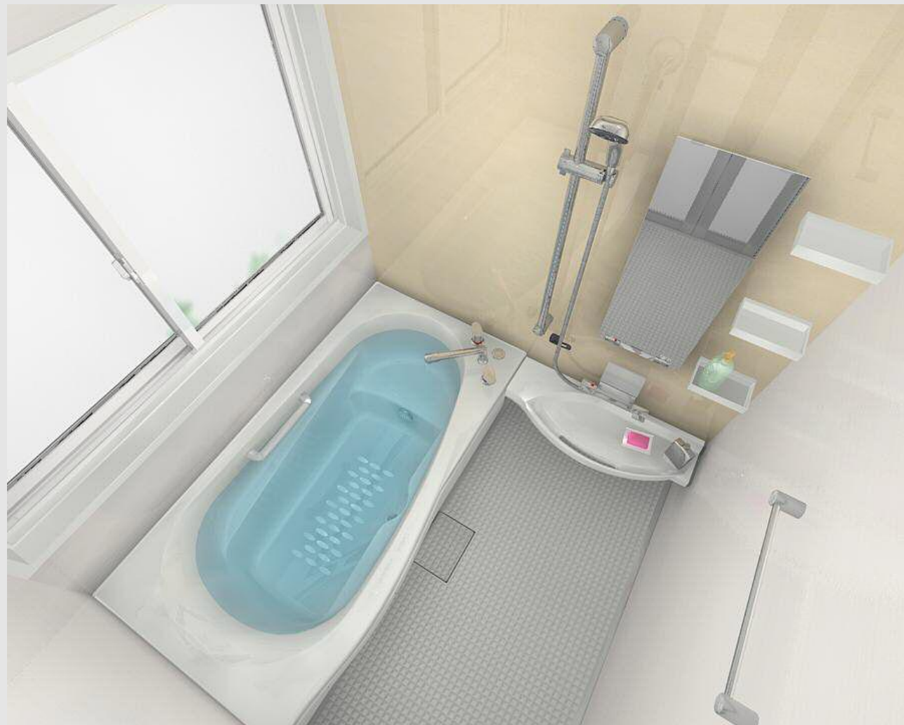
CG合成によるイメージ画像です。 窓サッシはイメージであり、選定仕様には含まれていません。